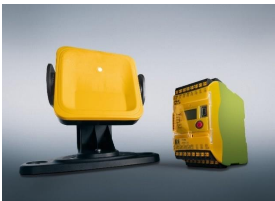
Afb. 3: F_Press_Innovative_PSEN_rd1_2_sensor_6B000003_PNOZ_m_B0_7721 00_6997_B8_2_cold

Onderschrift: PSENradar van Pilz is uitgerust met sensoren met een detectiebereik van 0 tot 5 meter of van 0 tot 9 meter. Hierdoor is een efficiënte beveiliging van mobiele toepassingen mogelijk.