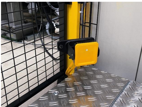
Fig. 2: F_Weidplas_PSEnradar_IMG_7198_cold1

Didascalia immagine: La soluzione radar di sicurezza PSEnradar di Pilz in Weidplas, nell'immagine uno dei tre sensori radar. Grazie all'acquisizione tridimensionale dell'area, rileva i movimenti nello spazio protetto.