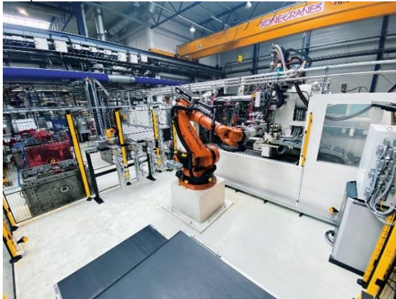
Fig. 1: F_Weidplas_Roboterzelle_IMG_7204_cold1

Didascalia immagine: Sicurezza nello spazio protetto con soluzione radar di Pilz: robot nell'area di prelievo della macchina per lo stampaggio a iniezione in Weidplas, in primo piano il nastro trasportatore.